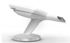
PRISE D'EMPREINTE OPTIQUE