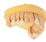
CÉRAMISATION ET CARACTÉRISATION