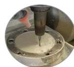
FABRICATION DES ARMATURES