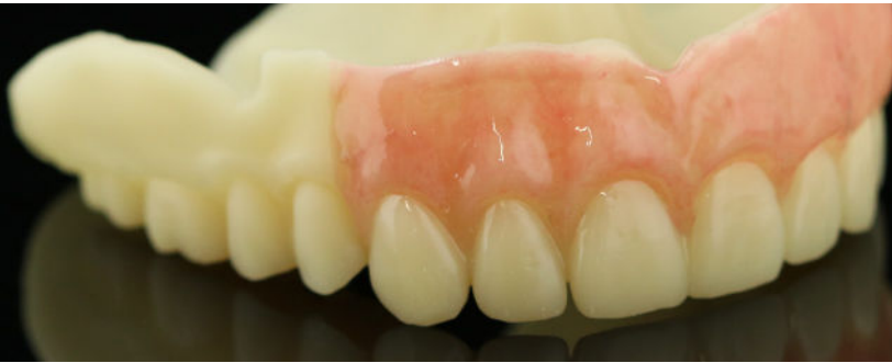
Avec maquillage de la gencive

Le monobloc est, comme son nom l'indique une seule pièce comprenant les dents et la gencive , imprimée grâce à nos imprimantes 3D. Nous proposons 2 types de monoblocs : une version classique couleur dent (A3) et une version avec maquillage de la gencive, pour un rendu plus esthétique, qui est proposé en option.